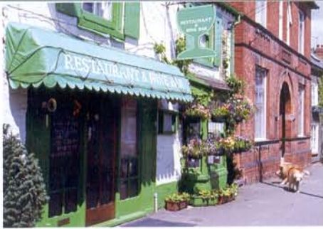
Markiezen gestikt met GORE™ TENARA®-naaigaren behouden gegarandeerd hun waarde.